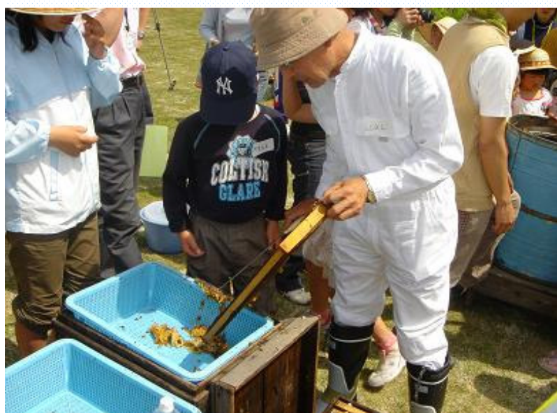
山田養蜂場の方に教わりながらみつばちの巣箱からはちみつを採取しました。