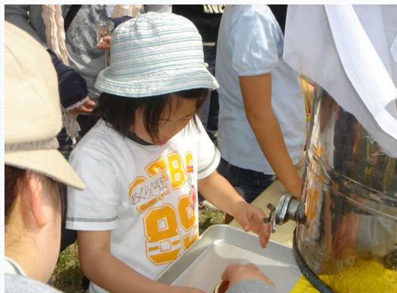
あま〜い、あまいはちみつがとれました☆