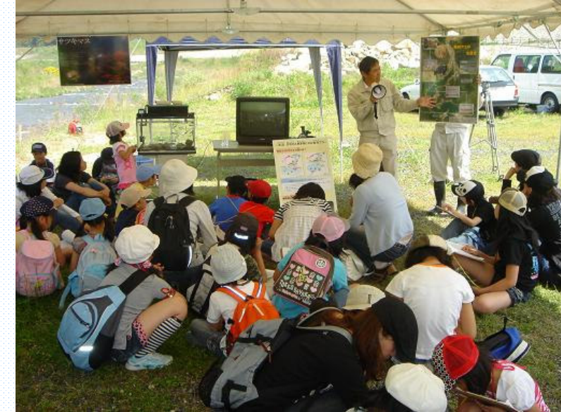
岡山県魚病指導センターの方から陸封鮎、あまごのことを教えて頂きました。