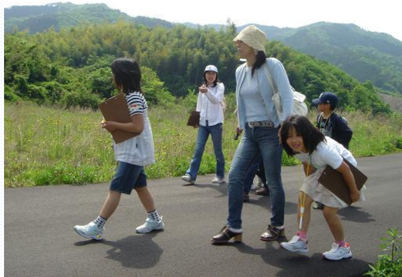
参加者全員でエコハイク。豊かな自然に触れながらのハイキングはとっても気持ち良かったですね！