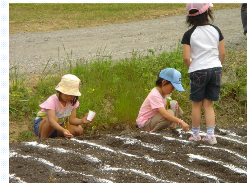
ひまわりの種まき、彼岸花球根の植え付け 今から花が咲くのが待ち遠しいですね。