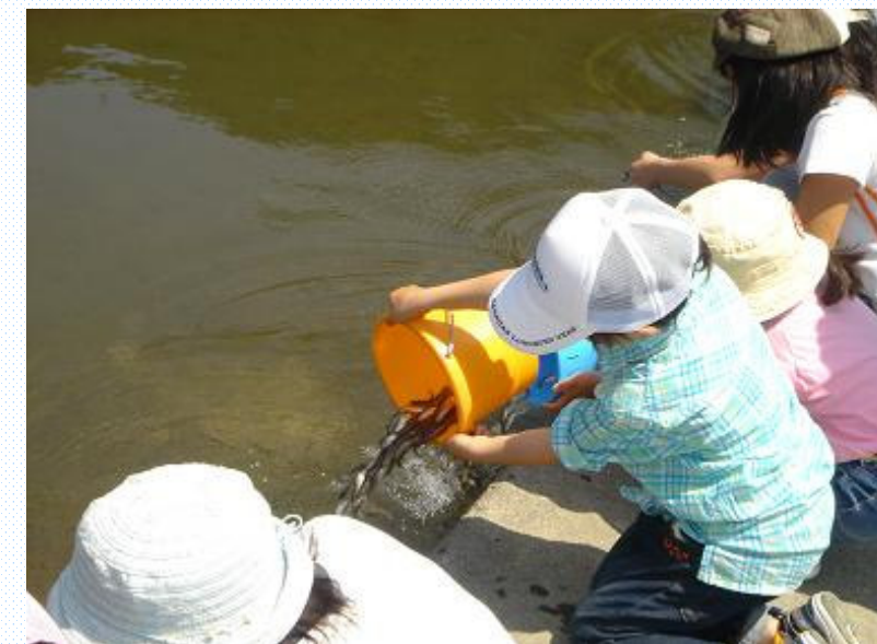
あまご、鮎の放流を体験