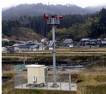
警報所のサイレン・スピーカ