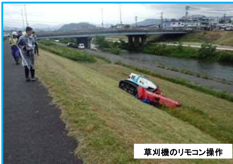
草刈機のリモコン操作