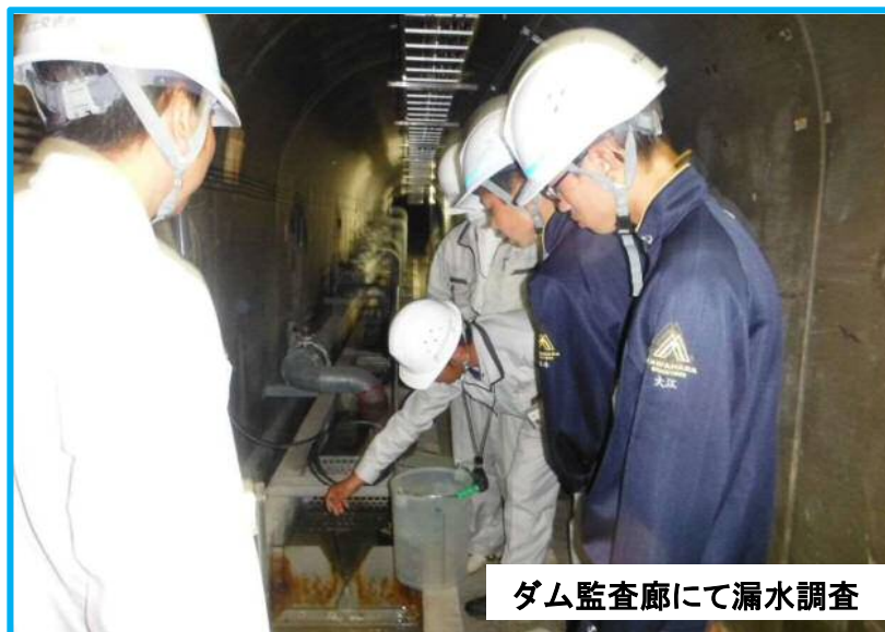
ダム監査廊にて漏水調査