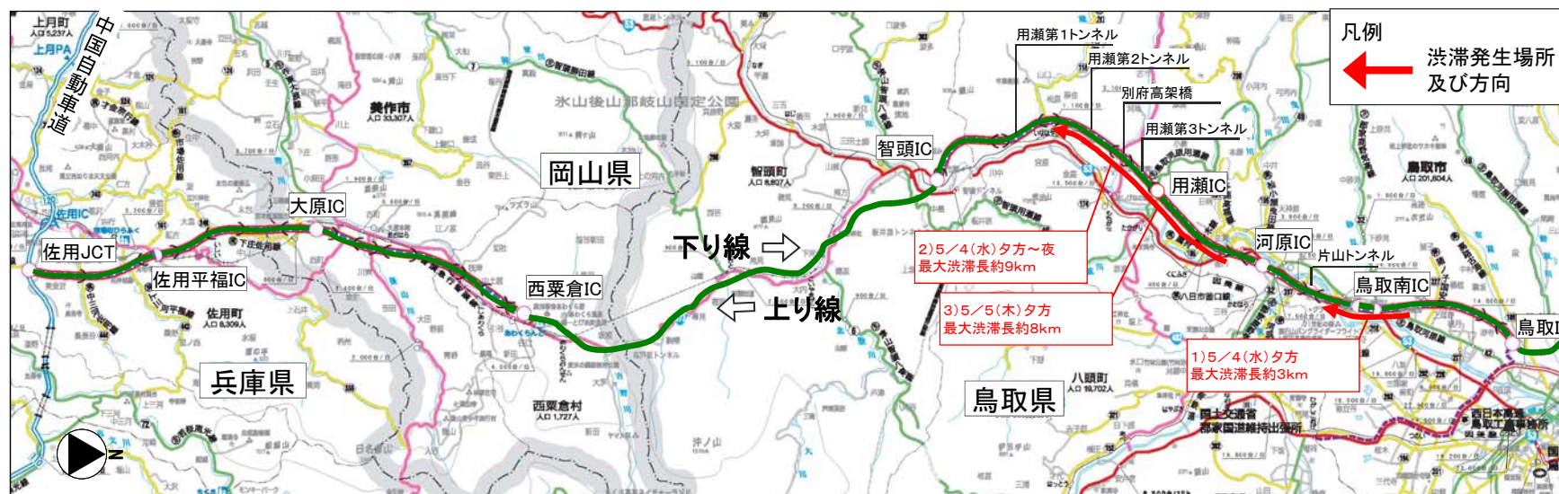
【表3】GW期間中における 渋滞発生状況