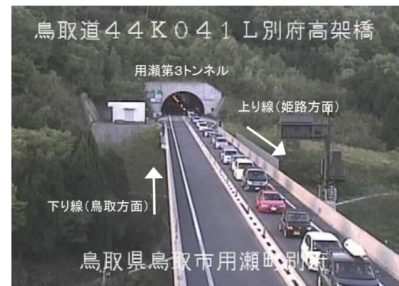
5月4日(水)夕方～夜 上り線(姫路方面)で最大約9kmの渋滞 (18時20分頃撮影 鳥取市用瀬町別府地内)