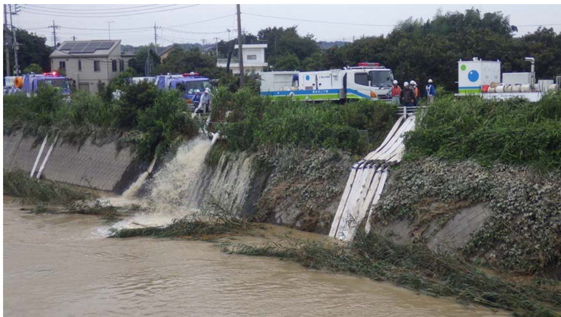
平成27年9月関東・東北豪雨災害派遣時の排水作業状況（茨城県常総市）