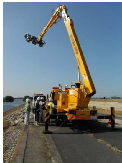
照明車の訓練状況