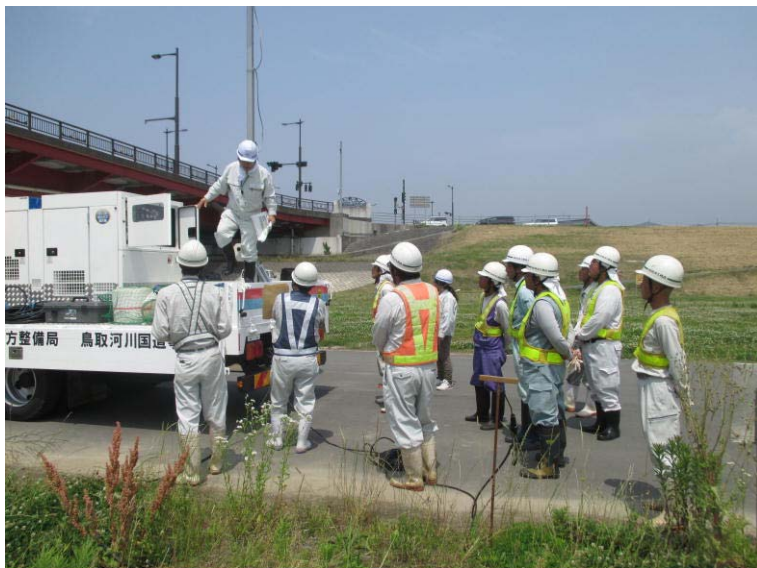
排水ポンプ車説明状況