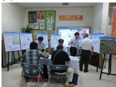
⇐ 6月21日、22日に鳥取市役所 駅南庁舎で開催した様子