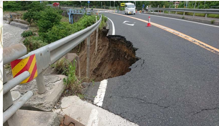
【新用瀬橋より撮影】