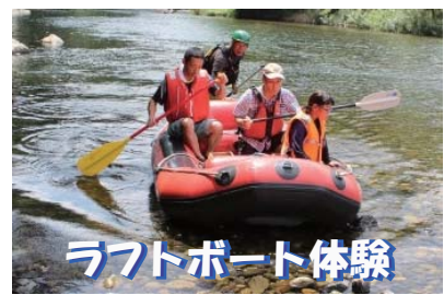
ラフトボート体験