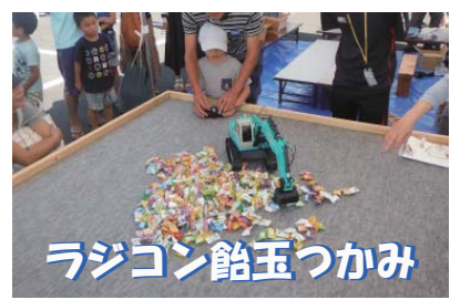
ラジコン飴玉つかみ