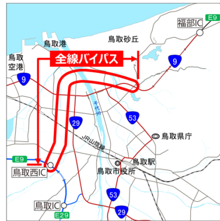
選定した概略計画