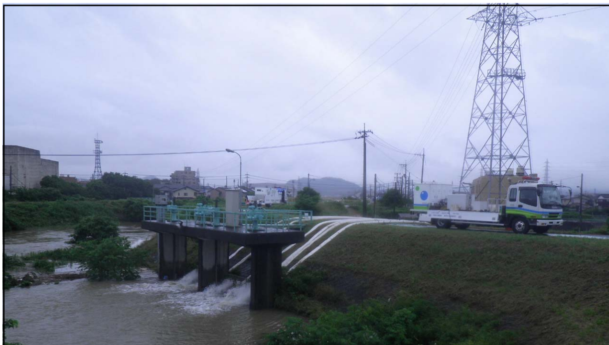
平成30年7月7日 清水川排水機場付近における排水作業状況 （鳥取県鳥取市吉成南地先）