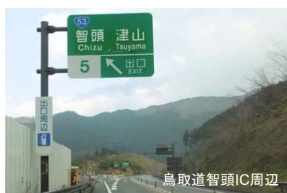
▲設置事例(鳥取自動車道)