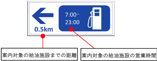
▲ 山陰道を降りた先の案内 (自治体(道路管理者)設置)