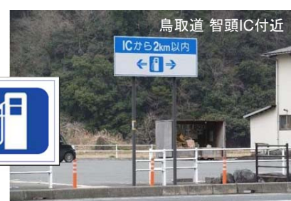
▲設置事例(鳥取自動車道)