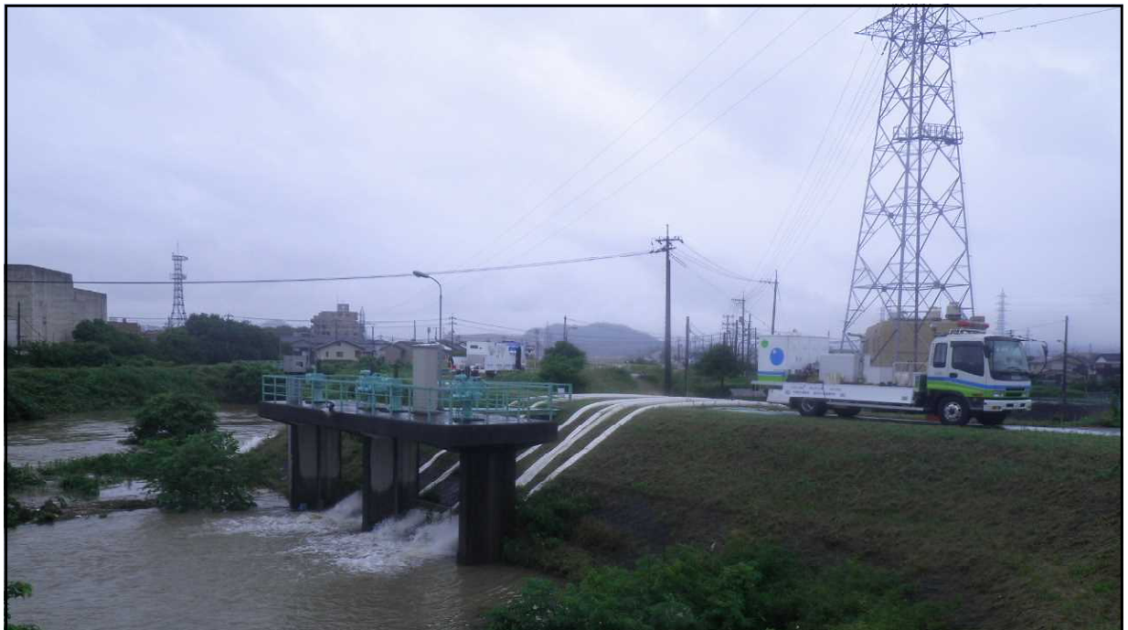
平成30年7月7日 清水川排水機場付近における排水作業状況 （鳥取県鳥取市吉成南地先）