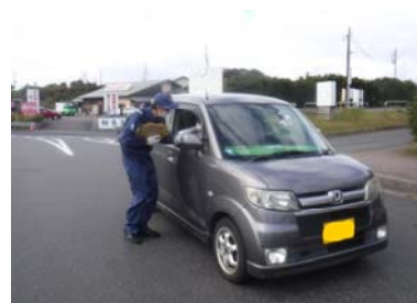
運転手への早期装着の呼びかけ状況