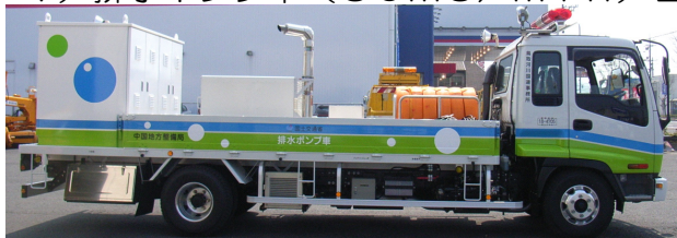
【排水ポンプ車① 水中ポンプ6台搭載】