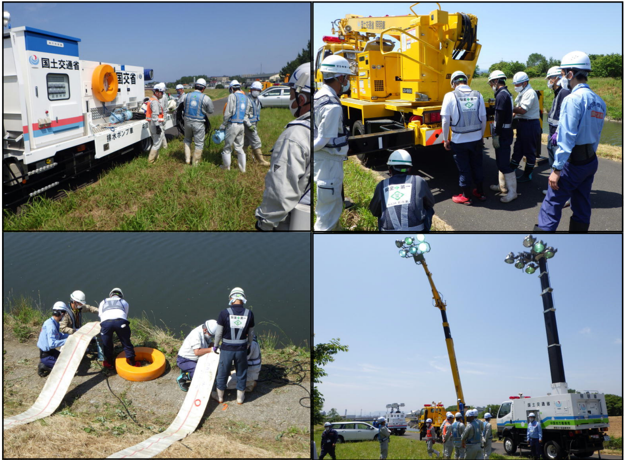
【排水ポンプ車訓練状況】