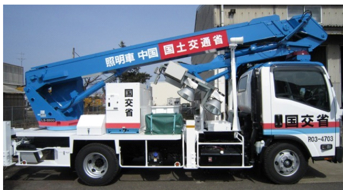
【照明車② 屈折ブーム式】