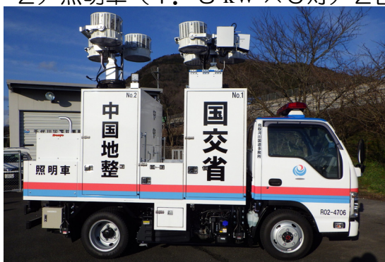
【照明車① 伸縮ポール式】