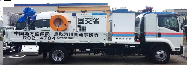
【排水ポンプ車② 水中ポンプ4台搭載】