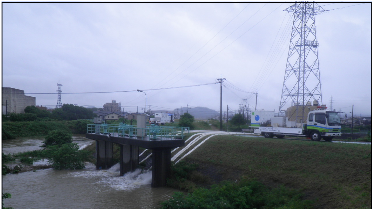
【排水作業状況（鳥取県鳥取市吉成南地先）】