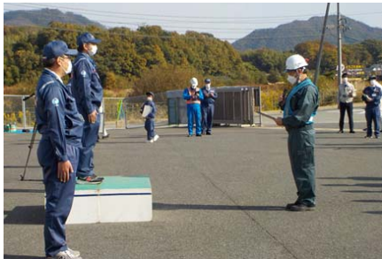
保守業者決意表明