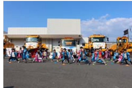
園児によるすずっこ踊り