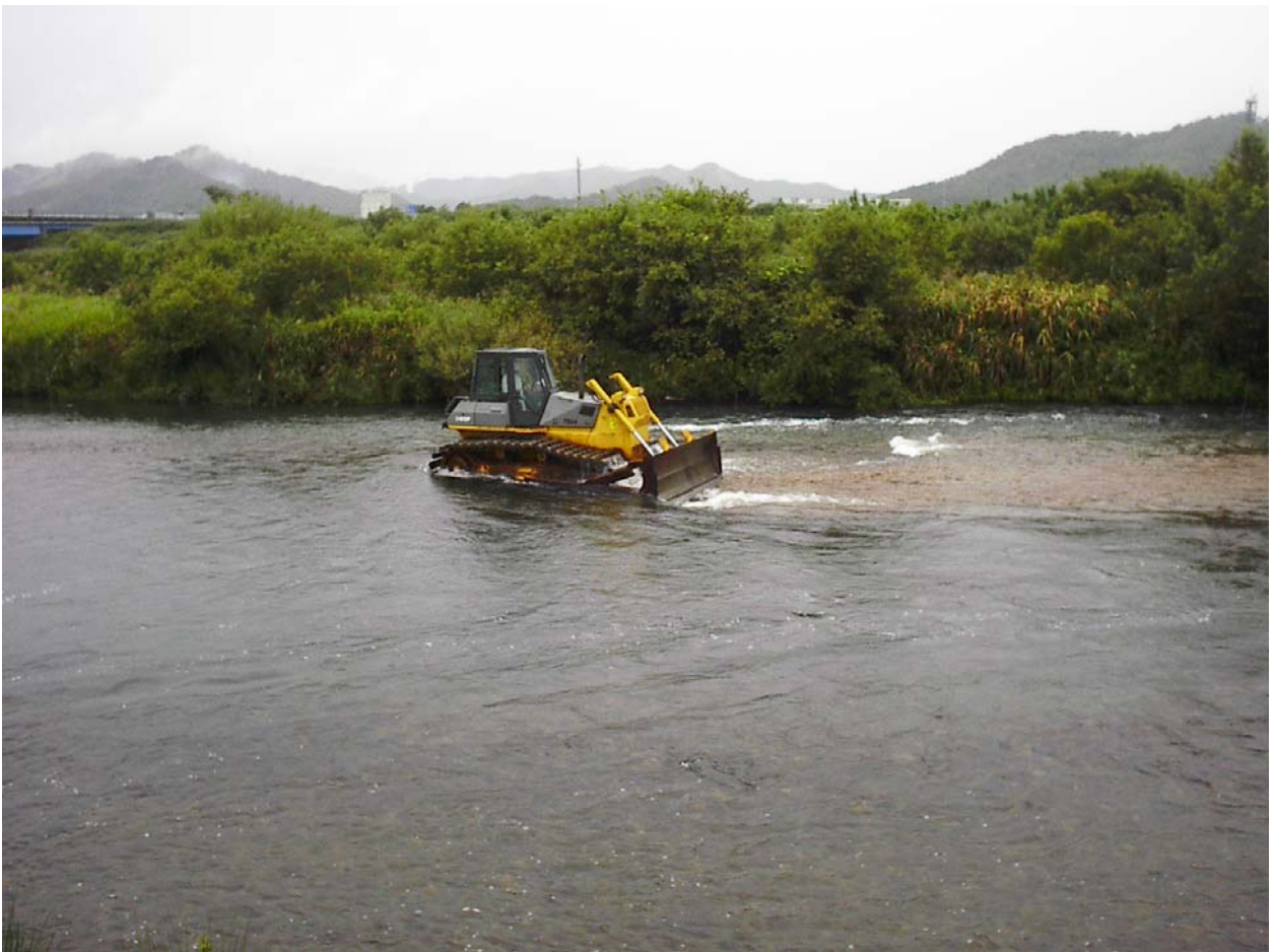
昨年の実施状況（ブルドーザーによる河床整正）