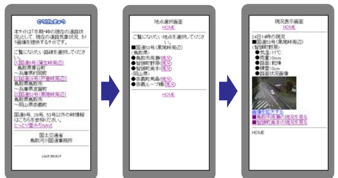
携帯電話での提供画面