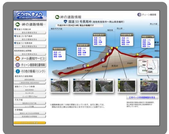
パソコンでの提供画面