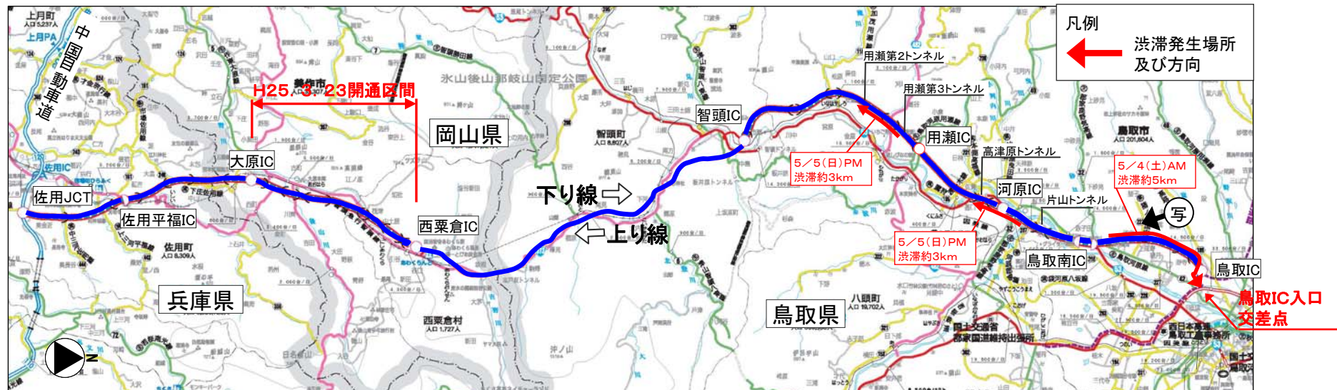
GW期間中の渋滞発生状況表