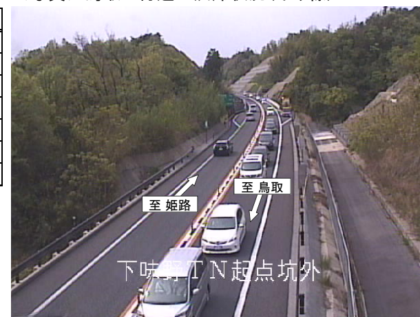
5月4日(土・祝日)AM 下り線(鳥取方面)最大約5km渋滞