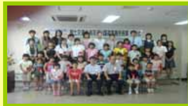
鳥取河川国道事務所の表彰式にお集まり頂いた皆さん