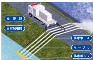
排水ポンプ車の作業イメージ

台風や豪雨などで河川の水が溢れたり、山が崩れたりした時に少しでも被害を小さく、少しでも早く元の状態に戻せるように、国土交通省鳥取河川国道事務所では排水ポンプ車と照明車を配備しています。