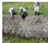
(鳥取県土木整備部 河川課)

平成27年4月17日~4月23日、鳥取県土木防災・砂防ボランティアの協力を得て、千代川水系の県管理区間において堤防点検を実施しました。点検の結果、石積の抜け落ち等修繕を要する箇所が数箇所確認されましたので、これらの箇所については、適宜対応を図る予定です。なお、今後も定期的に巡視を行い、堤防の安全確保に努めていきます。