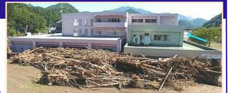
平成28年台風10号により、岩手県の要配慮者利用施設では利用者9名の全員が死亡。