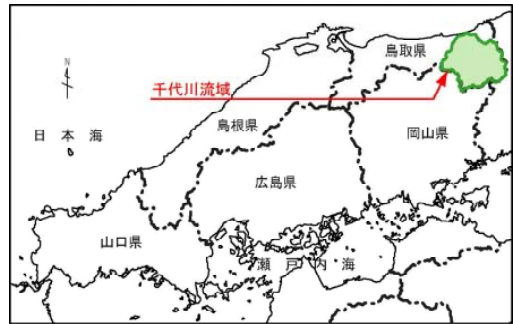
(参考図)千代川水系図