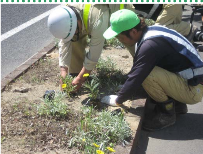
～ 植え付け穴にガザニアンクインを植え付け～