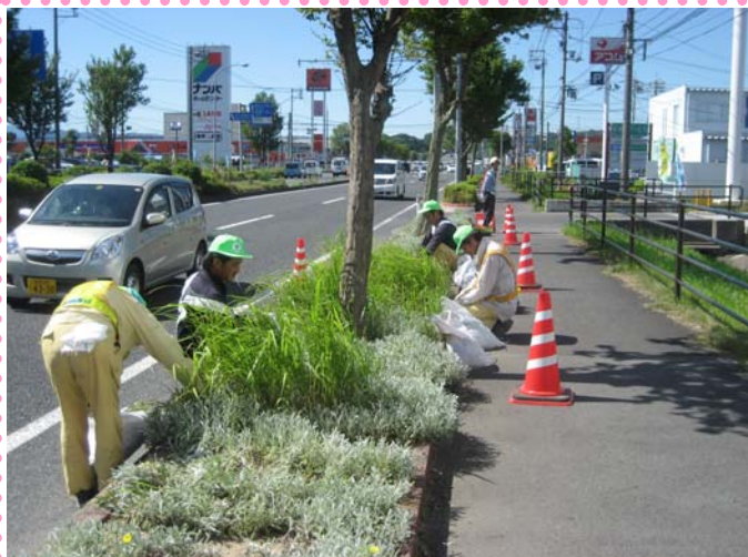
～ 花植え前に入念に除草 ～