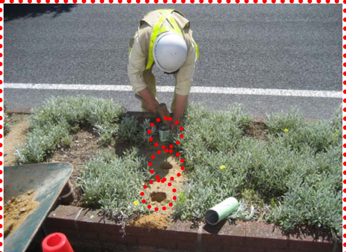
～ 植え付け穴を施工 ～