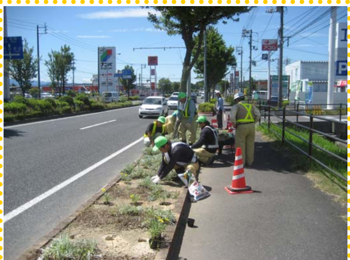
～ 仕上げに肥料を入れて花を元気に♪ ～