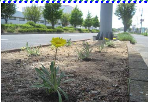
花壇が一段と綺麗になりました♪

★★ 「安長フラワーロード」より ★★ 天気が良すぎて土が固く、植付作業がとても大変でした (>_<) しかし、「安長フラワーロード」では花壇の土を改良し草を生えにくくしているため、草取りは楽でした！ 「トース土工法」と言う工法です。草取りで苦勞しているボランティア団体の方は是非ご相談ください (^_^) 今回は100株を植えて国道29号の美化に貢献させていただきましたが、もっと花壇を華やかにして地域の方の心を晴れやかにできたらいいなと考えています。