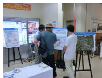
鳥取市駅南庁舎でのオープンハウスの様子

第2回 <開催日時> 平成30年7月6日(金)～9日(月) 10:00～17:00 <開催会場> イオンモール鳥取北 モール棟1階 SM2前通路