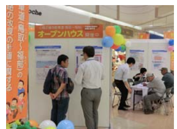
イオンモール鳥取北でのオープンハウスの様子