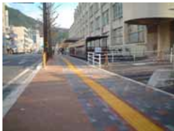
バリアフリー化された歩道 (鳥取市東町国道53号)

鳥取県内では、鳥取駅周辺をバリアフリーの重点整備地区と設定し、順次整備を実施 平成15年末では、重点整備地区内でのバリアフリー化率は44% 道路の整備だけでなく、視覚障害者用の信号設置(鳥取県公安委員会)、JR駅でのバリアフリー化(JR西日本)も各関係機関と一体的に整備を実施