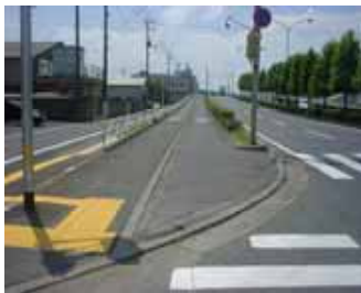
現在の鳥取鹿野倉吉線