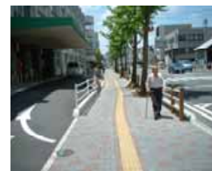
鳥取市東町(国道53号)