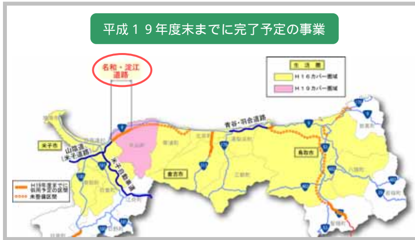
名和・淀江道路の概要は「整備事例」P.9を参照

生活圏中心都市30分カバー率の平成19年度目標値は93%であり、平成17年度から3ポイントの増加を目指します。