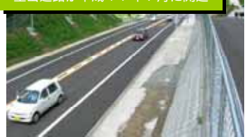
生山道路が平成17年7月に開通