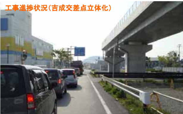
吉成交差点「西方面」を望む