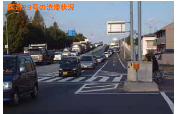
吉成交差点から因幡大橋を望む