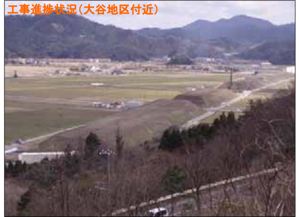
大谷地区から岩美IC方面を望む