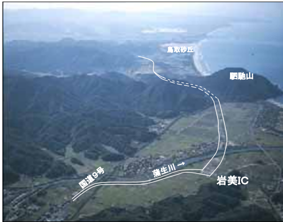
岩美IC付近から西方面を望む