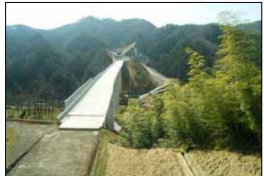
佐用～西粟倉間 美作市(中西橋付近)