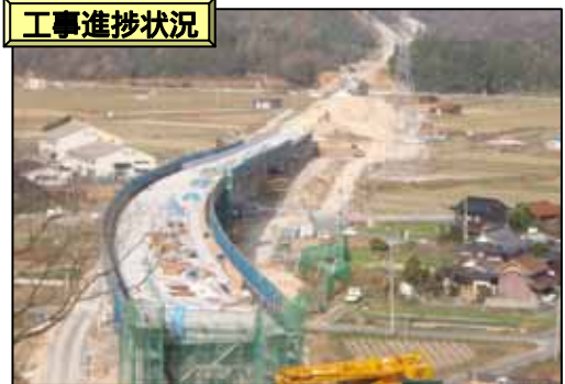
河原～鳥取間 鳥取(倭文玉津高架橋付近)