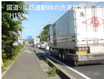
国道9号朝通勤時の渋滞状況 (H19.6) 下坂本交差点付近より東方面を望む