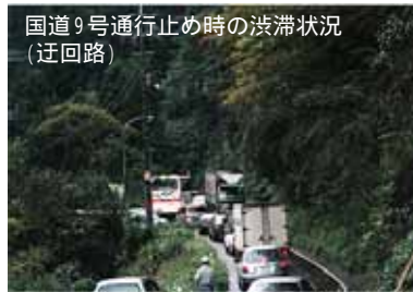
国道9号通行止め時の渋滞状況 (迂回路) 鳥取鹿野倉吉線 (三徳地区)