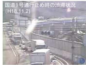
国道9号通行止め時の渋滞状況 (迂回路) 八束水ト利付近より西方面を望む