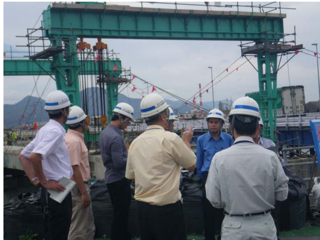
▲一般国道2号 栄橋架け替え現場 H25.9.6

▲ 講義状況 ▲ 日本語をラオス語に通訳します。 テキストは、英語で記載されています。