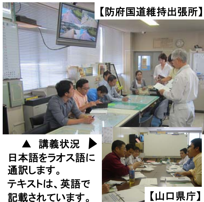
【防府国道維持出張所】

日本の技術・手法を取得して頂き、ラオスで効率的な道路維持管理に役立つことを期待します。