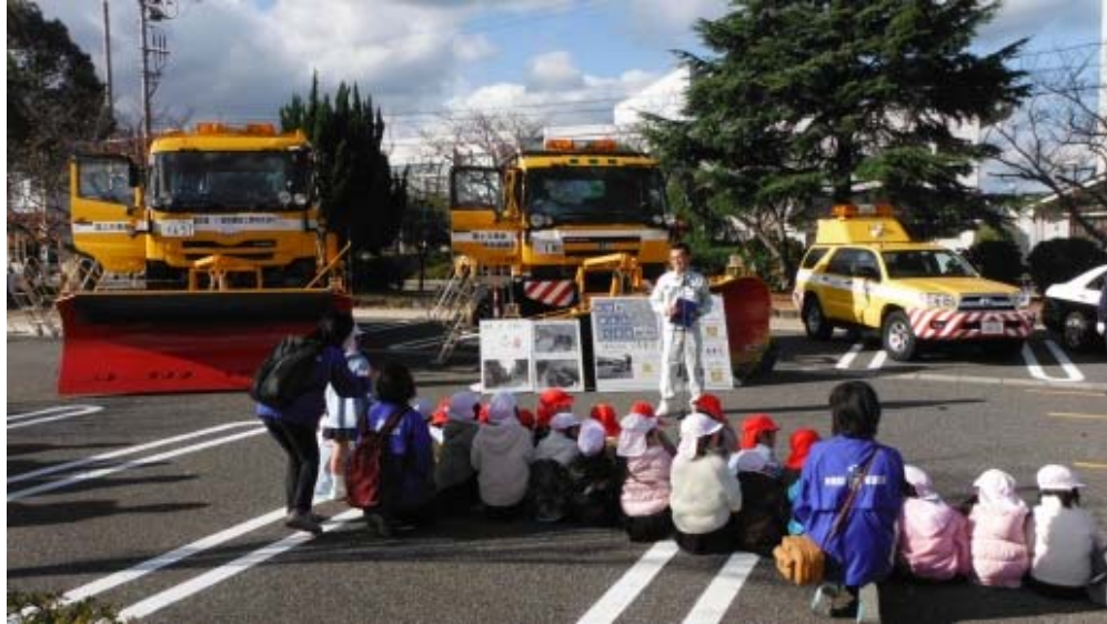
▲ 除雪トラックや道路パトロールカーについて説明。

山口河川国道事務所では、国が管理する道路の除雪や凍結防止の作業を行っています。近隣の萩光塩学園幼稚園・宮野幼稚園の皆さんを招待し道路除雪の大切さの学習や、除雪機械の乗車などのふれあい体験を行いました。