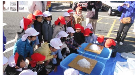
▲ 凍結防止剤の効果の様子