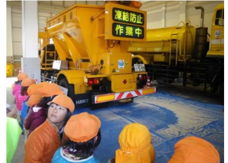
▲ 凍結防止剤散布布車