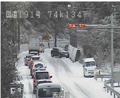
国道191号 椎ノ木峠 (長門市) H24

～冬用タイヤ未装着車両による走行不能やスリップ事故による交通障害が発生しています～