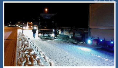
国道2号周南市椿峠の状況