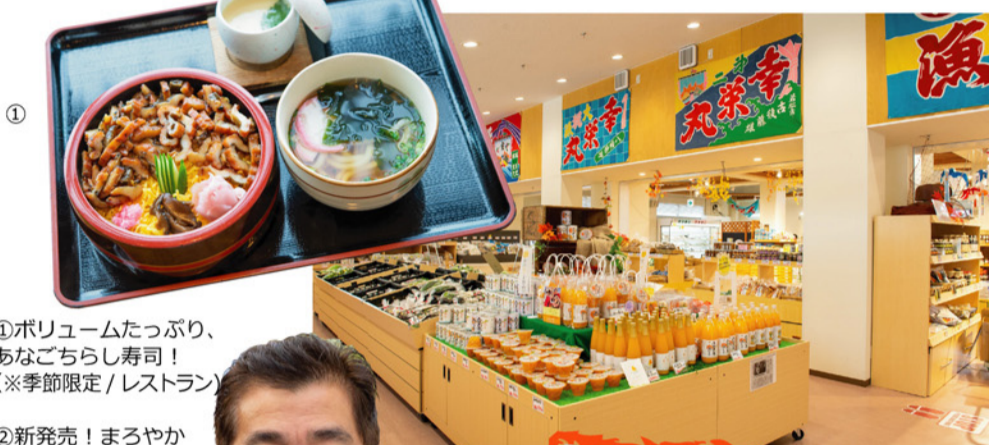
①ボリュームたっぷり、 あなごちらし寿司！ (※季節限定/レストラン)

瀬戸内のハワイこと周防大島町、国道437号沿いに佇むのは道の駅サザンセトとうわ。 7月13日に直売所をリニューアルし、売り場面積を約1.5倍に拡充—冷凍海産物やハワイアンコーナー、地域の人 の日常品などの販売、レンタサイクルのサービスを開始しました。 こちらの駅でのオススメは、いりこやひじきの加工品と柑橘類。柑橘類が山口県内の生産量8割以上を占める周防 大島では、これからの季節に様々な柑橘類が登場します。柑橘類の加工品も豊富で、ストレートジュースや果肉ゼリー をはじめ、パンやお餅、大福など多種多様な品ぞろえです。冬にオススメの一品は、鍋料理にぴったりの「みかん胡椒」。 2Fのレストランでは冬限定でみかん鍋が楽しめます。