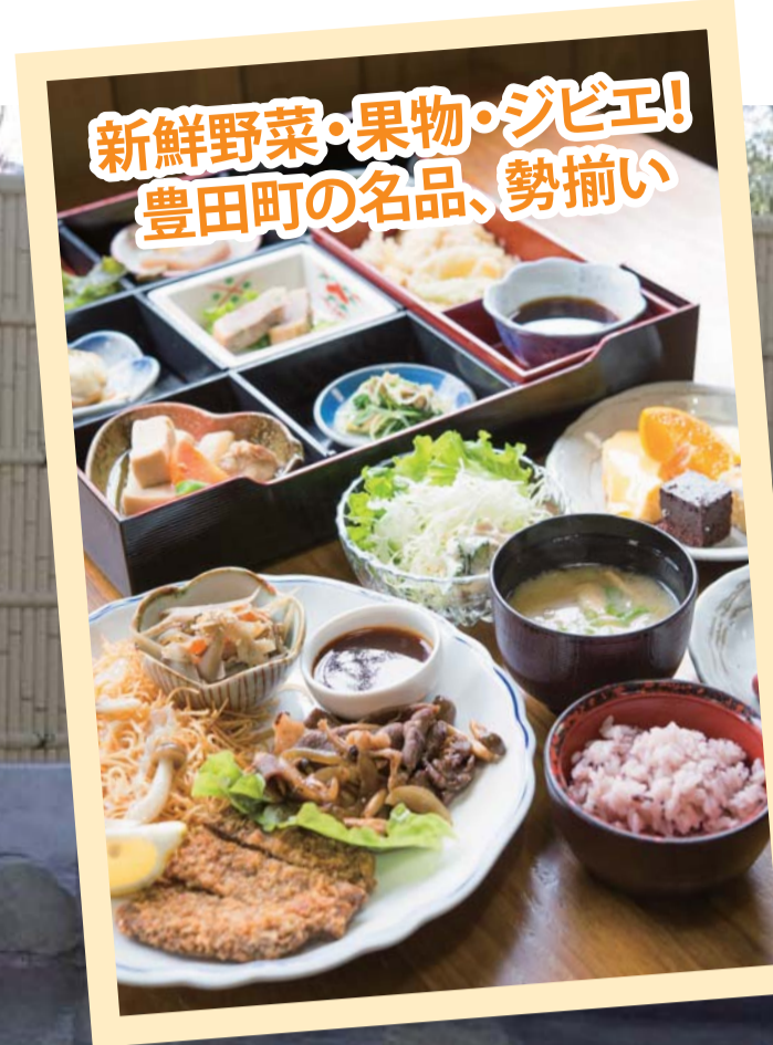
道の駅 蛭街道 西ノ市 下口駅長

地元の食材を用いた ジビエ料理や梨の加工品が 自慢です。 毎週日曜日イベント開催中