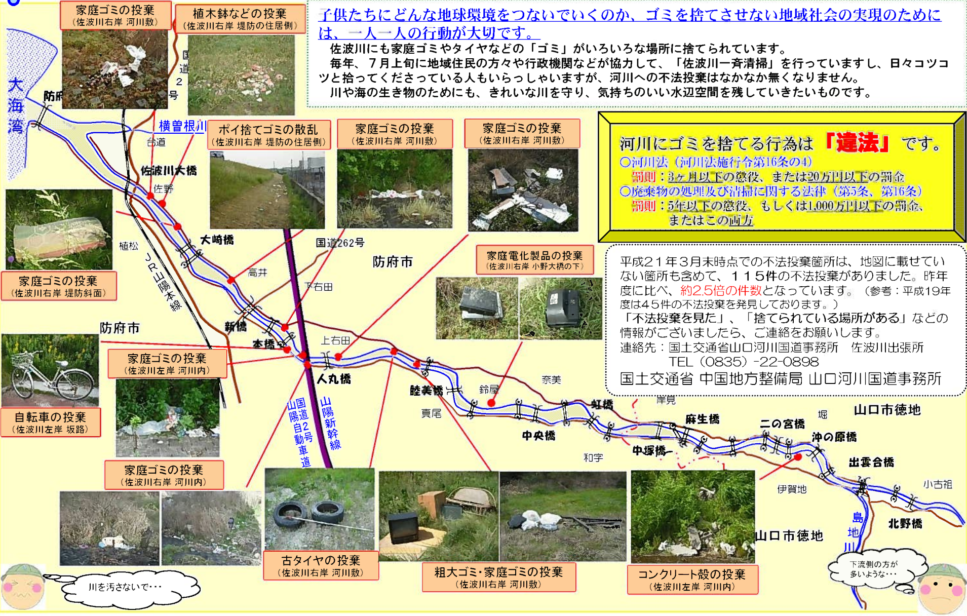
家庭ゴミの投棄 (佐波川右岸 河川敷)

平成21年3月末時点での不法投棄箇所は、地図に載せていない箇所も含めて、115件の不法投棄がありました。昨年度に比べ、約2.5倍の件数となっています。（参考：平成19年度は45件の不法投棄を発見しております。） 「不法投棄を見た」、「捨てられている場所がある」などの情報があれば、ご連絡をお願いします。 連絡先：国土交通省山口河川国道事務所 佐波川出張所 TEL (0835) -22-0898 国土交通省 中国地方整備局 山口河川国道事務所