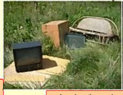
粗大ゴミ・家庭ゴミの投棄 (佐波川右岸 河川敷)