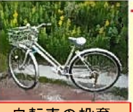
自転車の投棄 (佐波川左岸 坂路)