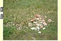
ポイ捨てゴミの散乱 (佐波川右岸 堤防の住居側)