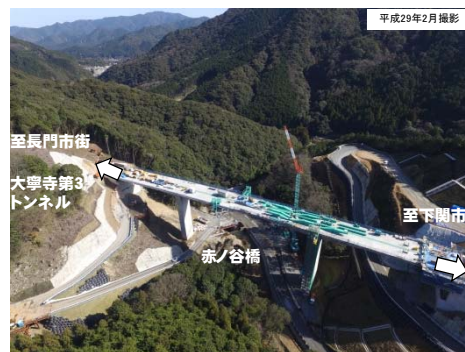
写真① 事業進捗状況 (長門市深川湯本(赤ノ谷)から長門市街方面を望む)