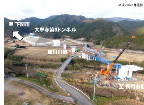
写真② 事業進捗状況 (長門市街方面から下関方面を望む)