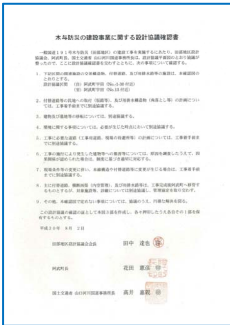
設計協議確認書の締結(田部地区)

今後、工事用道路の設計につきましても本線同様に皆様と協議させていただきますので引き続きよろしくお願いいたします。