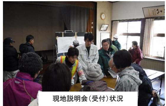
現地説明会(受付)状況