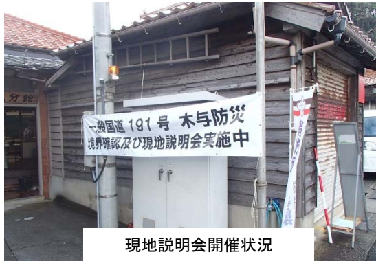
現地説明会開催状況

本線に引き続き平成30年8月31日より順次行ってまいりました「工事中道路の現地説明・境界確認」が平成30年12月15日に終了いたしました。皆様へおかれましては、お忙しいところご参加いただき、誠に有り難うございました。