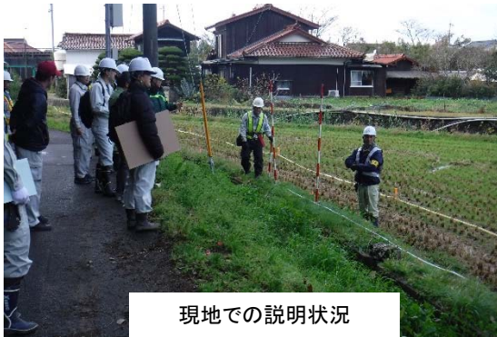
現地での説明状況