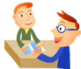
補償金額等の説明