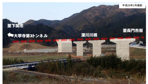
写真② 事業進捗状況 (長門市街方面から下関方面を望む)