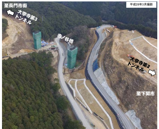
写真① 事業進捗状況 (長門市深川湯本(赤ノ谷)から長門市街方面を望む)