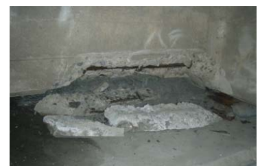
【損傷状況】コンクリート落下