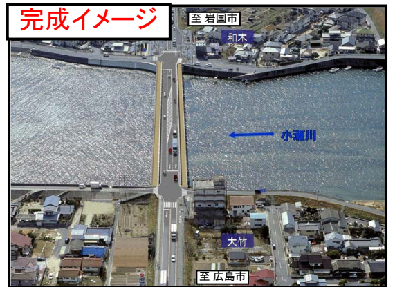
【写真②】栄橋 完成イメージ