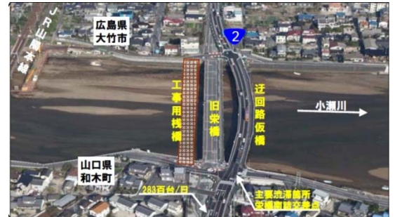
【写真①】施工状況(山口県側から広島県側を望む)