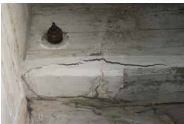
【損傷状況】橋本体のひび割れ