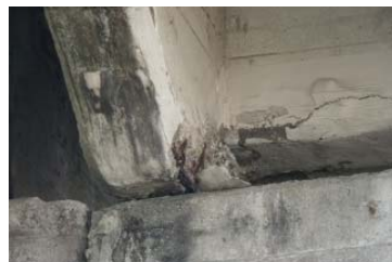
【損傷状況】橋本体のひび割れ