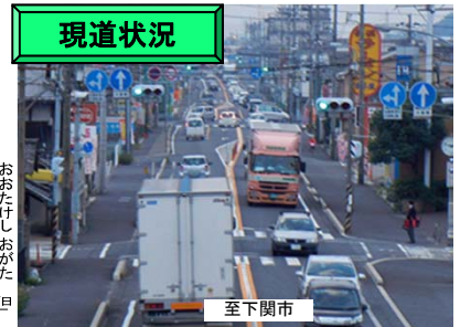
信号交差点が連続する大竹市街の道路状況