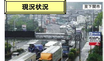
岩国新港地区(渋滞状況)