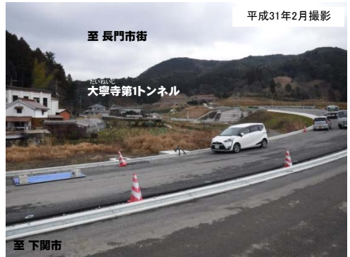
写真① 俵山小原地区 事業進捗状況