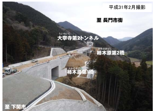
写真② 柿木原地区 事業進捗状況