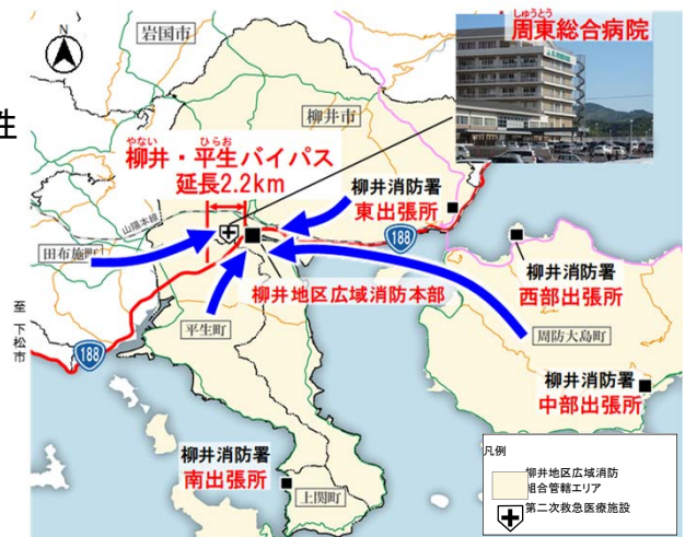
図 柳井・平生地域の救急搬送状況

※H27全国道路・街路交通情勢調査の混雑時旅行速度より整備後は、柳井・平生バイパス設計速度60km/hで算出