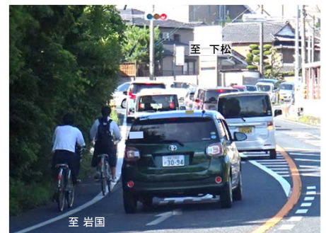
写真② 狭小区間における自転車走行状況