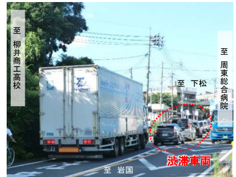
写真① 交通混雑の状況