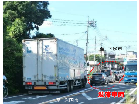
【写真①】交通混雑の状況