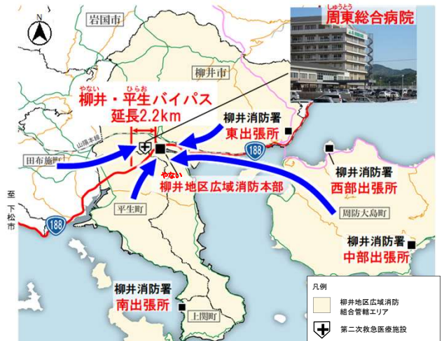
図 柳井・平生地域の救急搬送状況