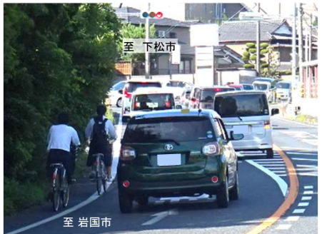
【写真②】狭小区間における自転車走行状況