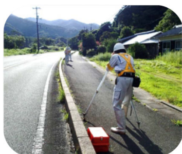
現地測量作業状況