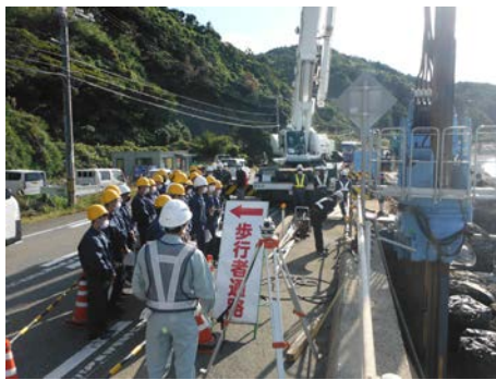
鋼矢板の打ち込み作業