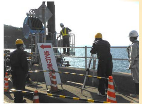
測量器具を用いて実際に生徒に計測してもらいました