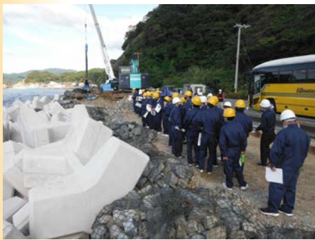
現場内の見学、工事内容の説明

「鋼矢板の目的や長さは？」など積極的に質問があり、地域で行われている事業に関心を持っていただけました。