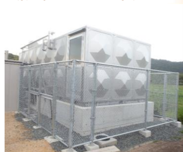
貯水し災害時に活用できる受水槽