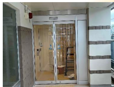
自動扉で防寒・防虫

引き続き、トイレ周辺の改修工事を行っています。ご不便をお掛けしますが、ご理解・ご協力をお願いいたします。