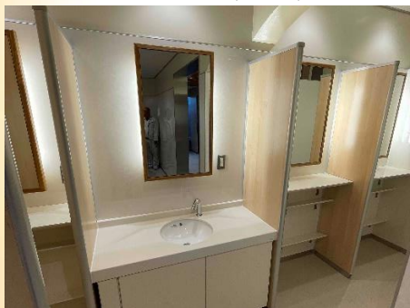
パウダールーム（改修）