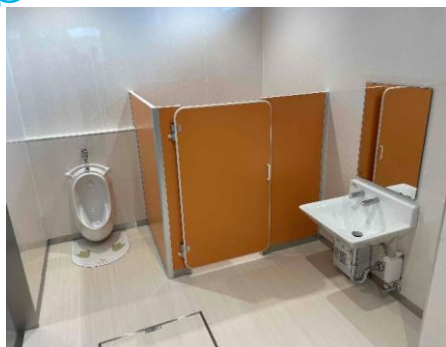
キッズトイレ（新設）